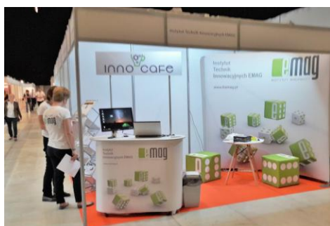
Stanowisko firmy EMAG.

Te specjalizacje inteligentne wskazują potencjał technologiczny naszego regionu. W szczególności zostały one ujęte i rozpisane w przyjętym przez Zarząd Województwa Śląskiego „Modelu wdrożeniowym Regionalnej Strategii Innowacyjności Województwa Śląskiego na lata 2013 – 2020”. „Międzynarodowym Targom Wynałazków i Innowacyjności INTARG 2017” towarzyszyła w dniu 22 czerwca br. konferencja „Śląskie Forum Innowacyjności 2017” / www.ris.slaskie.pl/ . To prestiżowe i ważne wydarzenia z punktu widzenia regionu. Zarówno targi jak