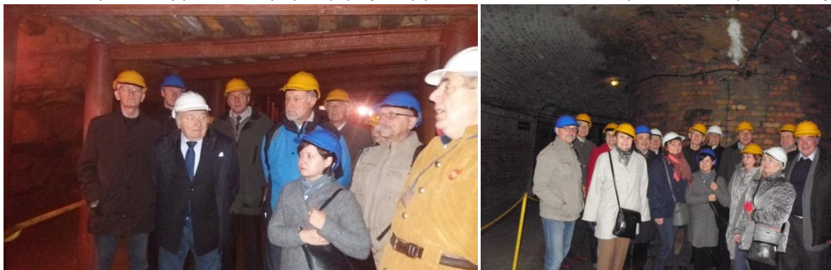
Fot. 40 m pod ziemią

Kopalnia ta została w tym roku wpisana na Listę światowego dziedzictwa UNESCO. Jest jedyną w Polsce trasą turystyczną, która została wytyczona w podziemiach będących pozostałością po dawnych kopalniach rud srebra, ołowiu i cynku. Stanowi niewielki fragment dawnej kopalni Fryderyk. Do zwiedzania została udostępniona w 1976 r. W tym roku zostało uruchomione także Multimedialne Muzeum Górnictwa, które zwiedziliśmy. Później przeszliśmy i przepłynęliśmy prawie dwu-kilometrowy szlak 40 m pod ziemią.