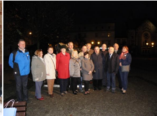
Pożegnanie na Tarnowskim Rynku