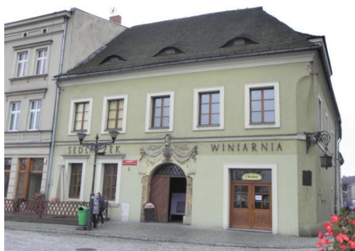
Fot. Wokół Rynku w Tarnowskich Górach