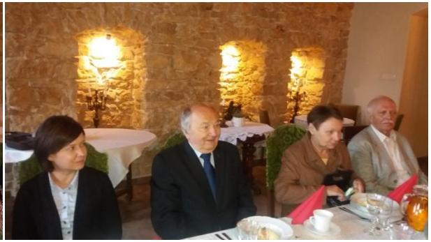
Fot. Goście z Oddziału Łódzkiego SEP