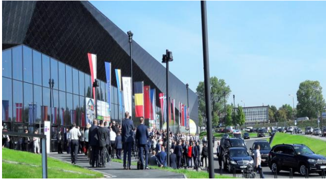
Moment przyjazdu delegacji rządowej na MTG,PE i H.

W dniu 29 sierpnia 2017 r. w Międzynarodowym Centrum Kongresowym (MCK) w Katowicach rozpoczęły się Międzynarodowe Targi Górnictwa, Przemysłu Energetycznego i Hutniczego "Katowice 2017". Organizatorem największych tego rodzaju targów górniczych w Europie jest Polska Technika Górnicza S.A. Targi odbywają się w dniach od 29.08. do 1.09. w godzinach od 10:00 do 17:00.