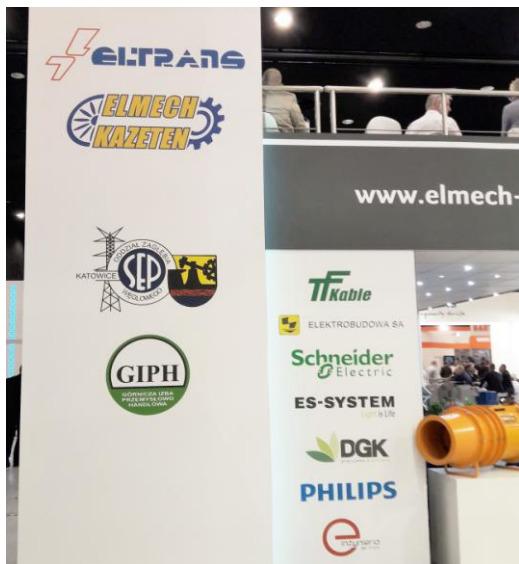
Logo OZW SEP na stanowisku Eltrans-u.