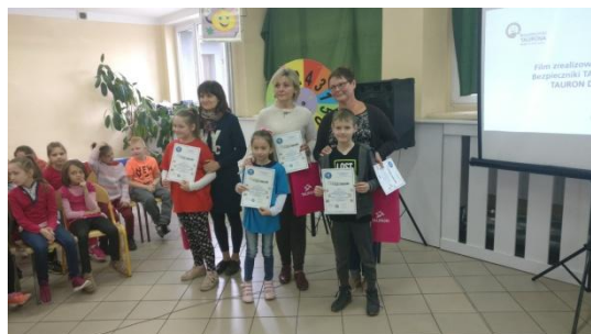
Fot. Uczestnicy konkursu „Pstryczek Elektryczek”