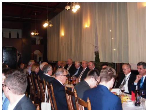
Fot. Spotkanie koleżeńskie