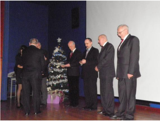
fot. Odznaczeni medalami