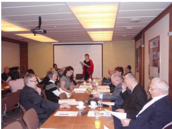
fot. Uczestnicy Wieczoru Pieśni Patriotycznej.

Przed zebraniem zarządu jego uczestnicy mieli okazję zwiedzić siedzibę firmy.