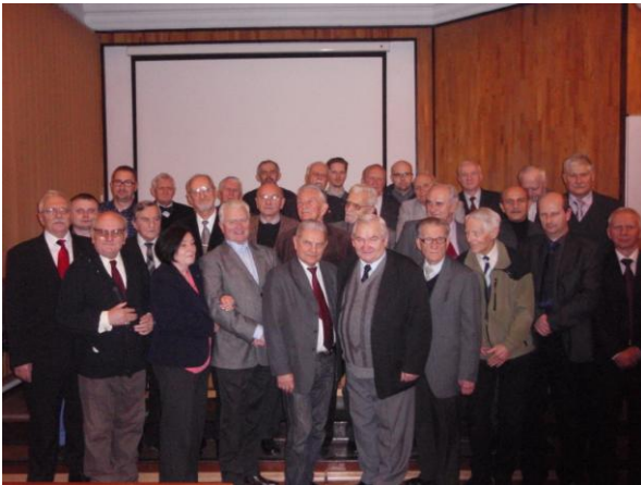
fot. Uczestnicy spotkania świątecznego Koła Terenowego i Klubu Seniora

19 grudnia – spotkanie świąteczne Koła Terenowego nr 26 w Katowicach i Klubu Seniora.