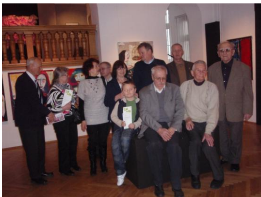
fot. W oczekiwaniu na przewodnika

21 marca - Impreza kulturalna - wyjście do Muzeum Śląskiego w Katowicach. W imprezie uczestniczyło 12 osób. Zwiedzono wystawy „Sztuka Łotwy” oraz „Komu piekło, komu raj. Wizje Sądu Ostatecznego w plastyce nieprofesjonalne”.