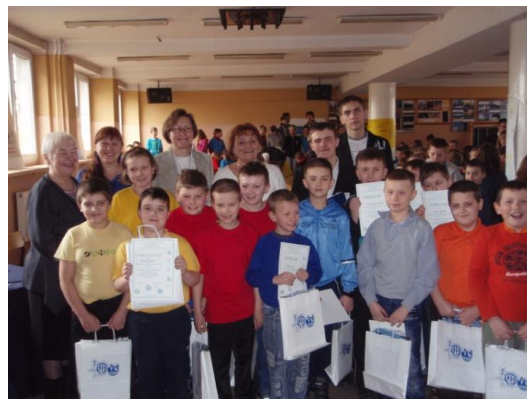
Fot. . Laureaci i opiekunowie VIII Konkursu dla Małolatów „Pstryczek-Elektryczek”.

W finale udział wzięło po trzech uczniów klas trzecich z pięciu szkół podstawowych z Rudy Śląskiej wyłonionych drogą eliminacji szkolnych. Finalistów głośno i energicznie dopingowali koleżanki i koledzy klasowi. Laureaci otrzymali stosowne dyplomy i nagrody ufundowane przez OZW SEP.