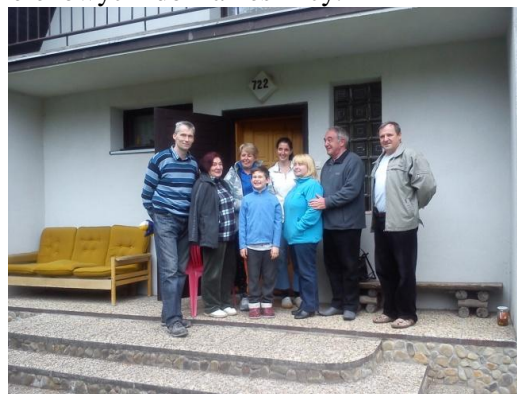
fot. W Kameszniczy

26 – 28 kwietnia – tradycyjny wyjazd majówkowy Kół Terenowych do Kameszniczy.