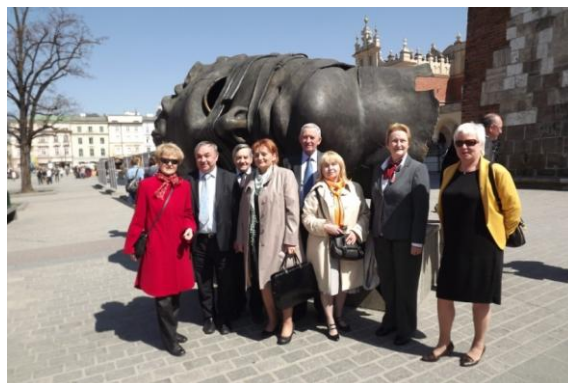
fot. na Krakowskim Rynku

23 kwietnia - spotkanie w Krakowie Prezydium – Oddziału Krakowskiego i Oddziału Zagłębia Węglowego SEP. Po przyjeździe do Krakowa uczestnicy zwiedzili Muzeum Narodowe w Sukiennicach. Dalsza część spotkania odbyła się w Domu Technika NOT, siedzibie Oddziału Krakowskiego SEP. Wymieniono doświadczenia dot. działalności statutowej i gospodarczej Oddziałów.