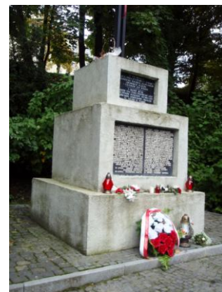
fot. Pomnik upamiętniający „Mord Profesorów Lwowskich”

w świetle którego jest widoczny stary pomnik (z prawej) z listą pomordowanych osób..