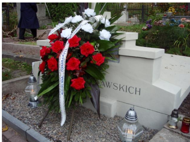
fot. Grobowiec Rodziny Dzieślewskich

Kulminacyjnym, bardzo wzruszającym momentem uroczystości było złożenie wieńca i zapalenie zniczy przy odnowionym grobowcu rodziny Dzieślewskich na Cmentarzu Łyczakowskim. Odnowienie grobowca stało się możliwe dzięki wniesieniu składek przez wszystkie oddziały SEP.