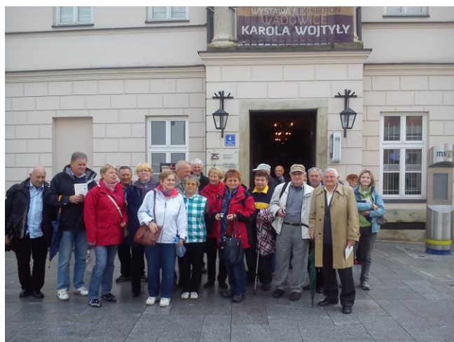
fot. Przed Muzeum w Wadowicach.

Wycieczkowiczom towarzyszyła niezbyt ładna pogoda, lecz wszyscy zachowali pogodę ducha.