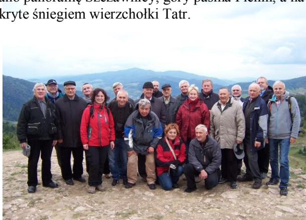
fot. Na Palenicy

Po obiedzie odbył się spacer z przewodnikiem po Szczawnicy. Wjechano kolejką na Palenicę Tam podziwiano panoramę Szczawnicy, góry pasma Pienin, a nawet pokryte śniegiem wierzchołki Tatr.