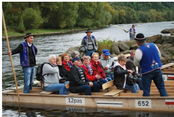
fot. Spływ przełomem Dunajcem

W II dniu zwiedzono ZEW Niedzica. Atrakcją był spływ tratwami flisackimi przełomem Dunajca. W III dniu zwiedzono Zamek w Niedzicy.