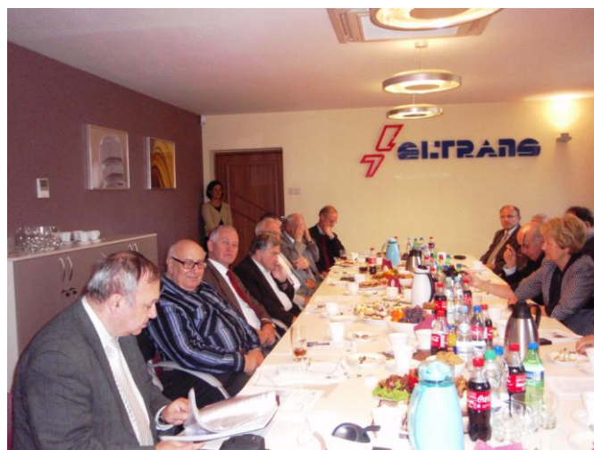
fot. Uczestnicy zebrania