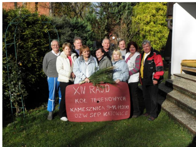
fot. W Kamesznicy

Na 2014 rok zaplanowano XV Rajd jako Ogólnopolski Rajd Kół Terenowych. Termin rajdu to I połowa wrze- śnia 2014 r.