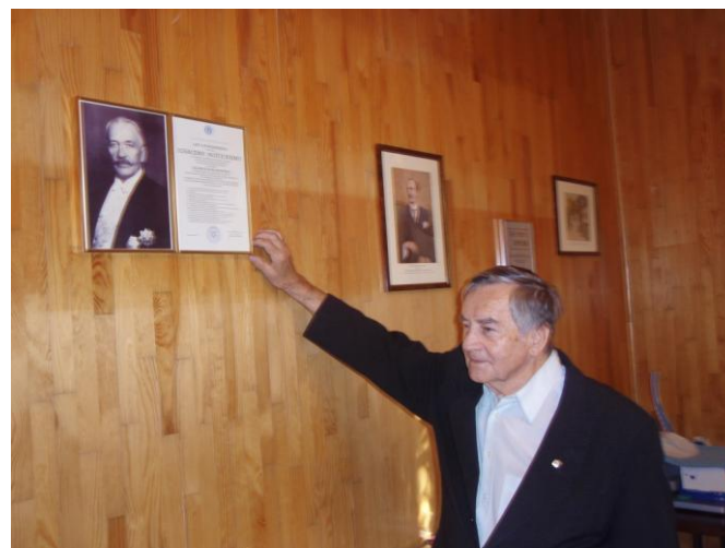
fot. Dekoracja sali prezydyjnej portretem Ignacego Mościc-kiego i kopią „Aktu nadania Członkostwa Honorowego”.