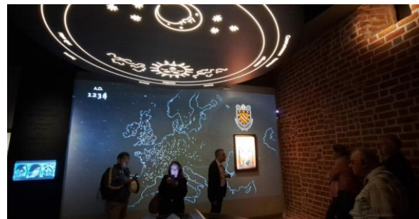
Zwiedzanie Muzeum Klasztorów Cystersów w Mogile.