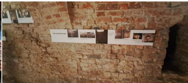
Centralne ogrzewanie piec hypocaustyczny *)