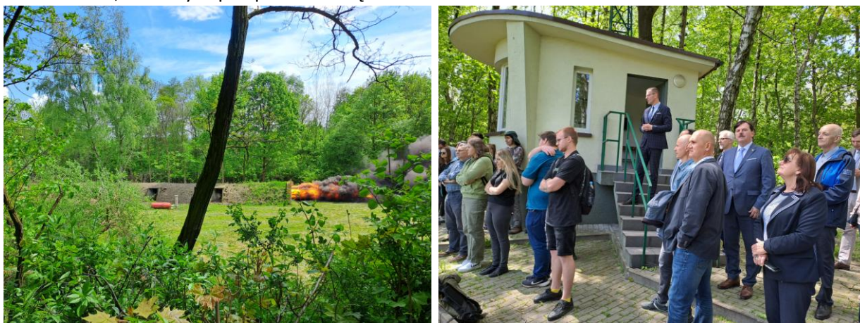
fot. Wybuch pyłu węglowego w sztolni doświadczalnej 100 m i obserwatorzy doświadczenia

W pierwszej części zebrania odbyła się prezentacja wybuchu pyłu węglowego. Zostaliśmy oprowadzeni po stanowiskach, na których przeprowadza się doświadczenia.