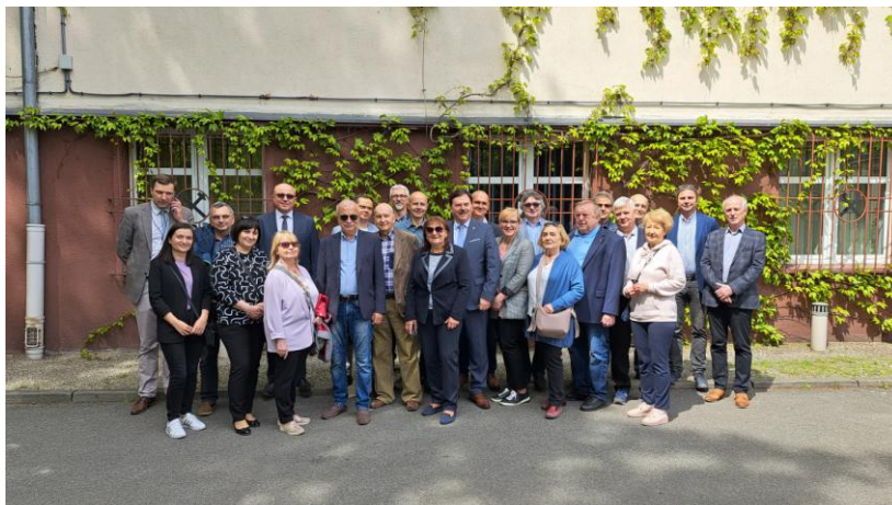
fot. Przed Dyrekcją Kopalni.

Kolejne Zebranie Zarządu zaplanowane jest na 26 września 2023 r.