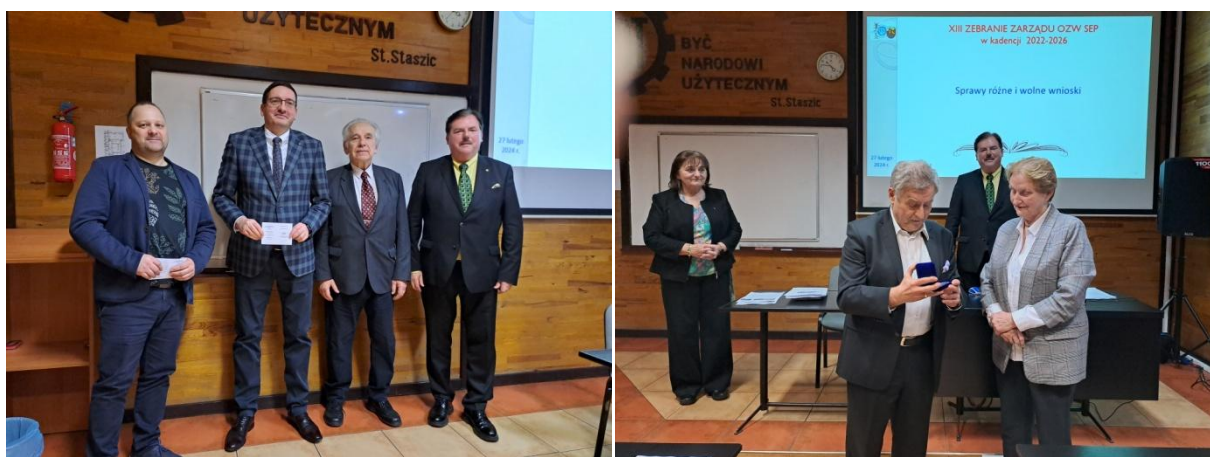
Z legitymacjami w ręce Specjaliści SEP medal pamiątkowy 100-lecia Polskiego Stowarzyszenia Inżynierów i Techników Województwa Śląskiego.