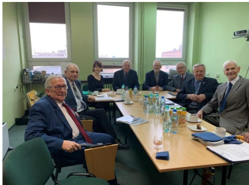
fot. Posiedzenie GSK

Uczestnicy zwiedzili Centrum Nauki i Techniki EC1..