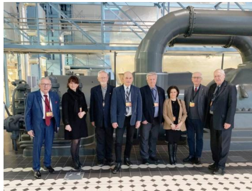
W Centrum Nauki i Techniki EC!